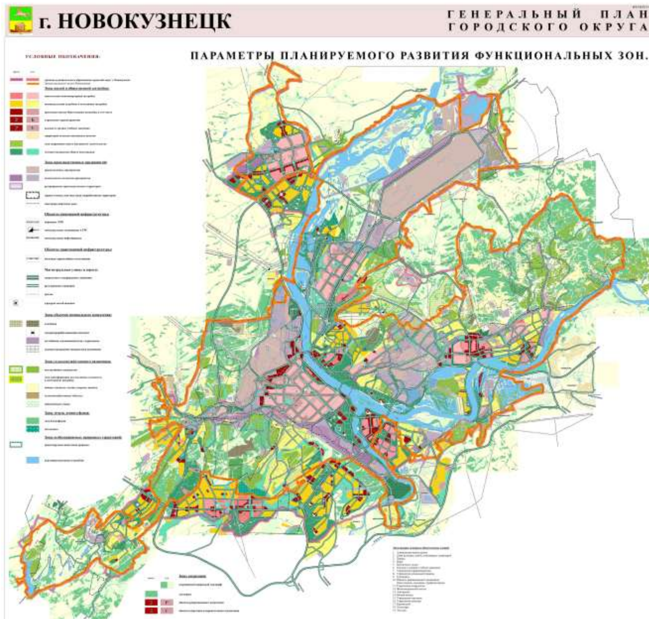
Схема Планируемых границ функциональных зон. Параметры Планируемого развития функциональных зон

Председатель Новокузнецкого городского Совета народных депутатов